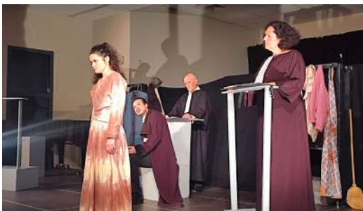
Spéctacle "Accusées XVII, levez-vous"