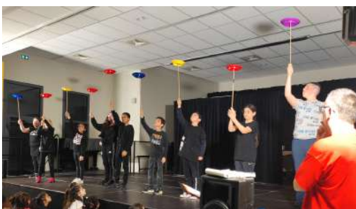
Spéctacle "Voyage, voyage"