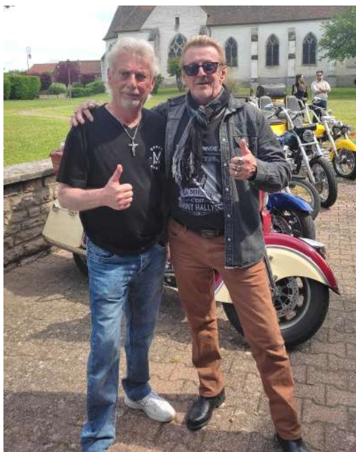
Festy Days Hallyday