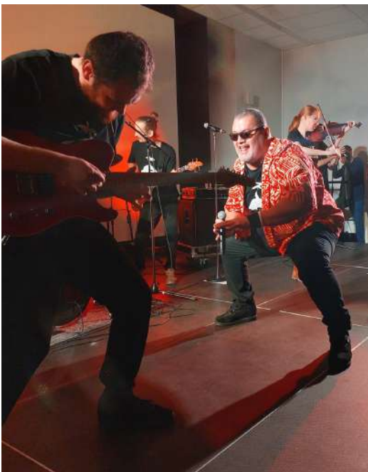
Concert Nua Nua