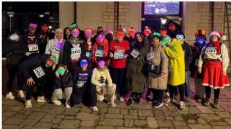
Joyeuses et prêtes pour participer à la corrida de Noël.

Dans le cadre du projet «Toutes sportives», initié par l'Ufolep de l'Aube, un groupe mères-filles du quartier Debussy a bénéficié de nombreuses activités autour du sport, du bien-être et du vivre-ensemble.