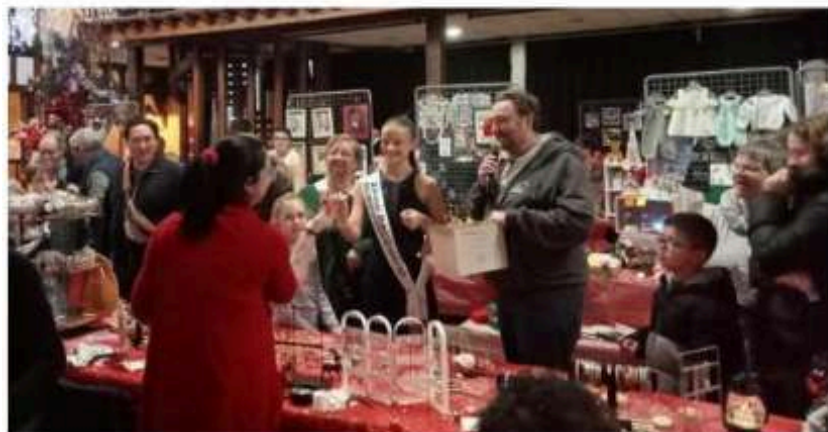
La deuxième dauphine de Miss TCM honorait le marché de sa présence.

Une belle effervescence régnait ce dimanche 14 décembre dans la salle des fêtes de Pont-Sainte-Marie, à l'occasion du deuxième marché de Noël. De nombreux stands de décorations, bijoux, confection, bougies, vin chaud, miel attiraient la foule des grands jours. Différentes associations maripontaines proposaient leurs créations atypiques et originales comme L'Outil en main, le scrapbooking, les tricotuses. Sur le stand du conseil municipal enfants, chacun pouvait s'informer sur la mise en place de projets culturels.