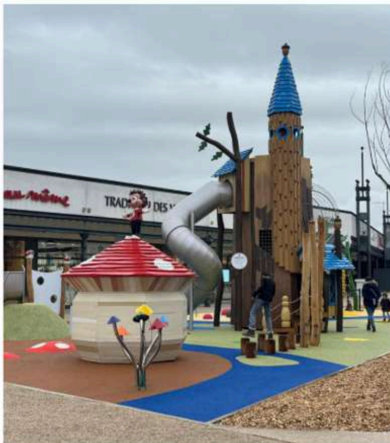
Ouverte ce jeudi 18 décembre, l'aire de jeux a déjà trouvé son public.

Le parc décline pour la première fois son activité de loisirs au cœur de l'agglomération troyenne avec une attraction ouverte à tous et gratuite. ●