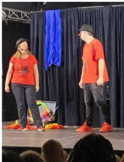
Que de rires déclenchés par les facéties des deux clowns !