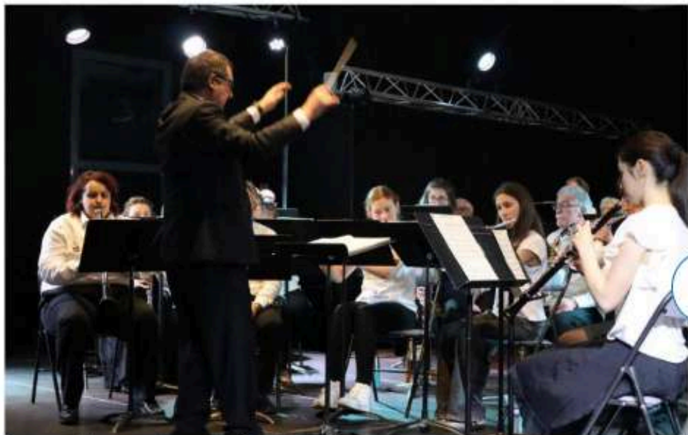
Les musiciens ont su envoûter le public.

Le week-end dernier s'avérait intensif pour les Maripontains du côté des festivités culturelles. Samedi, l'Harmonie de Pont-Sainte-Marie Lavau Creney se produisait en fin d'après-midi et en soirée sur la scène de la Maison de l'animation et la culture.